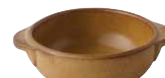
225-0150 薄茶 丸グラタン(大) 14.5×18×5.3cm 550cc 1,600円