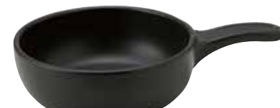
328-0153 黒片手グラタン 23×15.2×5.5cm 680cc 1,900円