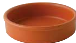
222-0173 オレンジ タパス14cm φ14×3.7cm 320cc 1,500円