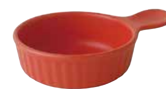
226-0114 赤 取手付きアヒージョ 15×11×3.8cm 220cc 1,700円