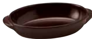
329-0151 茶楕円グラタン(小) 18.7×11×3.6cm 330cc 1,400円