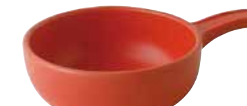
226-0153 赤 片手グラタン 15.2×23×5.5cm 680cc 2,100円