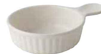
330-0114 白 取手付きアヒージョ 15×11×3.8cm 220cc 1,500円