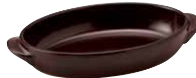
329-0152 茶楕円グラタン(大) 23.5×13.2×4.1cm 560cc 1,900円