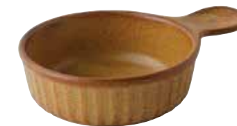
225-0114 薄茶 取手付きアヒージョ 15×11×3.8cm 220cc 1,500円