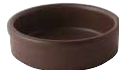
224-0171 茶 タパス12cm φ11.8×3.6cm 220cc 1,300円