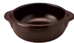
329-0149 茶丸グラタン(小) 14.5×12×4.5cm 275cc 1,200円