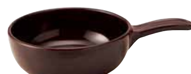
329-0153 茶片手グラタン 23×15.2×5.5cm 680cc 1,900円