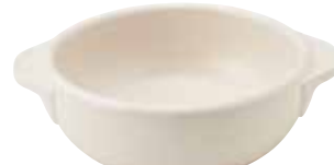
330-0150 白丸グラタン(大) 18×14.5×5.3cm 550cc 1,600円