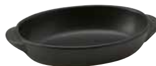
328-0151 黒楕円グラタン(小) 18.7×11×3.6cm 330cc 1,400円