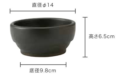
サイズ表記 凡例 (下図: 325-0135 黒 14cm)