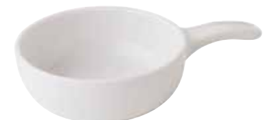
600-0153 白片手グラタン 14.5×21.7×5cm 550cc 1,600円