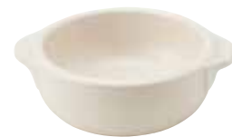
330-0149 白丸グラタン(小) 14.5×12×4.5cm 275cc 1,200円