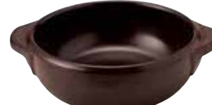
329-0150 茶丸グラタン(大) 18×14.5×5.3cm 550cc 1,600円