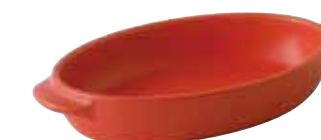
226-0151 赤 楕円グラタン(小) 18.7×11×3.6cm 330cc 1,600円