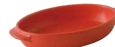
226-0152 赤 楕円グラタン(大) 23.5×13.2×4.1cm 560cc 2,000円