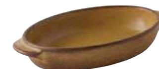
225-0151 薄茶 楕円グラタン(小) 18.7×11×3.6cm 330cc 1,400円