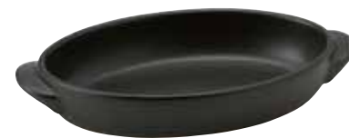
328-0152 黒楕円グラタン(大) 23.5×13.2×4.1cm 560cc 1,900円