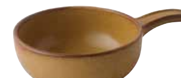
225-0153 薄茶 片手グラタン 15.2×23×5.5cm 680cc 1,900円