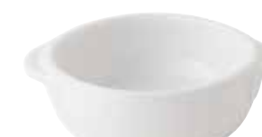
600-0150 白丸グラタン(大) 17.3×14×4.9cm 500cc 1,300円