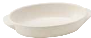
330-0151 白楕円グラタン(小) 18.7×11×3.6cm 330cc 1,400円