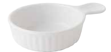
600-0114 白 取手付きアヒージョ 14.5×10.6×3.6cm 200cc 1,200円