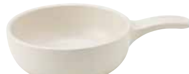
330-0153 白片手グラタン 23×15.2×5.5cm 680cc 1,900円