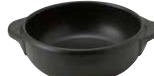
328-0150 黒丸グラタン(大) 18×14.5×5.3cm 550cc 1,600円