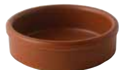
223-0171 レンガ タパス12cm φ11.8×3.6cm 220cc 1,300円