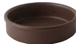
224-0173 茶 タパス14cm φ14×3.7cm 320cc 1,500円