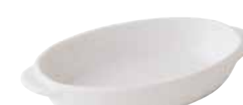
600-0152 白楕円グラタン(大) 19.2×17×5.2cm 670cc 1,600円