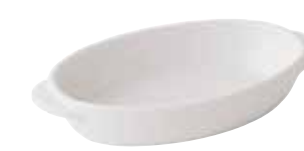
600-0151 白楕円グラタン(小) 10.2×17.7×3.3cm 450cc 1,200円