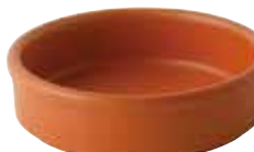
222-0172 オレンジ タパス13cm φ12.9×3.6cm 280cc 1,400円