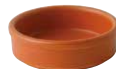
222-0171 オレンジ タパス12cm φ11.8×3.6cm 220cc 1,300円