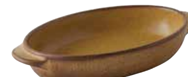
225-0152 薄茶 楕円グラタン(大) 23.5×13.2×4.1cm 560cc 1,900円