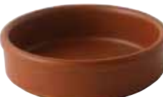
223-0172 レンガ タパス13cm φ12.9×3.6cm 280cc 1,400円