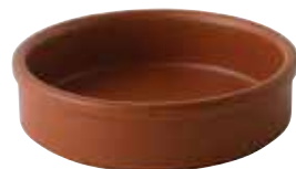
223-0173 レンガ タパス14cm φ14×3.7cm 320cc 1,500円