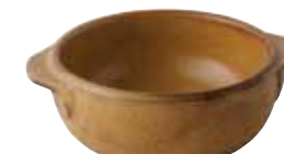
225-0149 薄茶 丸グラタン(小) 12×14.5×4.5cm 275cc 1,200円