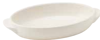
330-0152 白楕円グラタン(大) 23.5×13.2×4.1cm 560cc 1,900円