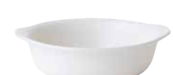
600-0139 キャセロール 19.2×17×5.2cm 670cc 1,600円