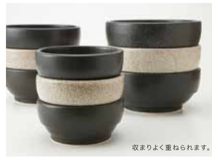
収まりよく重ねられます。