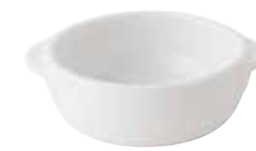
600-0149 白丸グラタン(小) 11.5×14×4.3cm 270cc 1,000円