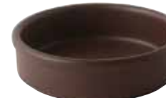
224-0172 茶 タパス13cm φ12.9×3.6cm 280cc 1,400円