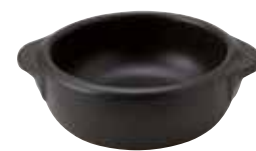
328-0149 黒丸グラタン(小) 14.5×12×4.5cm 275cc 1,200円