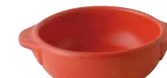
226-0150 赤 丸グラタン(大) 14.5×18×5.3cm 550cc 1,600円