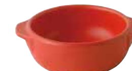
226-0149 赤 丸グラタン(小) 12×14.5×4.5cm 275cc 1,400円